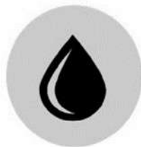
Afectació a la disponibilitat de recursos (aigua i energia)