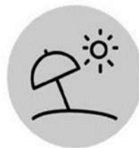
Extensió de la temporada turística de sol i platja